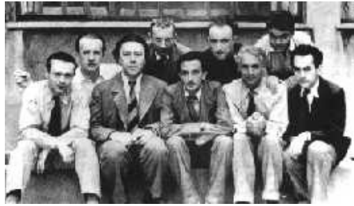
Die Surrealisten um 1930:

Tristan Tzara, Paul Eluard, Andre Breton, Hans Arp, Salvador Dali, Yves Tanguy, Max Ernst, René Crevel, Man Ray