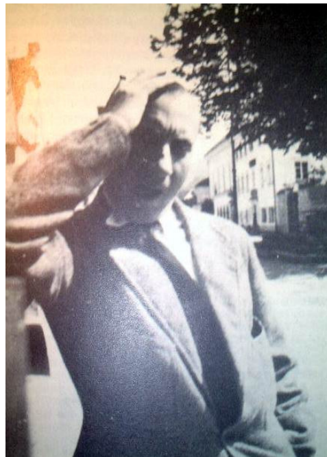
Hans Arp am Eck Hotel Hirsch in Reutte